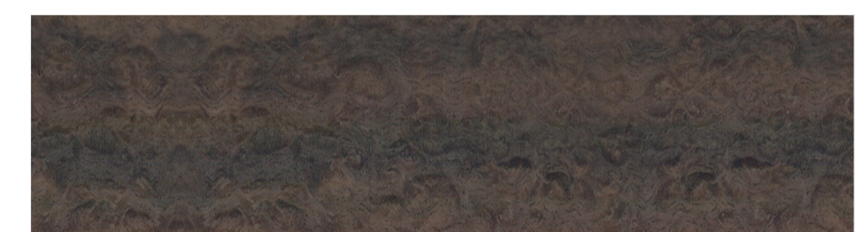
SMOKED OAK _ RÄUCHEREICHE