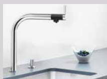
BLANCO VONDA in Edelstahl- oder Chromausführung.

Zur Entfernung hartnäckiger Kalkflecken und -ränder empfehlen wir BLANCO ANTIKALK . Die speziell auf BLANCO Küchenarmaturen und Spülen abgestimmte Rezeptur reinigt effektiv und ist dennoch schonend zu allen Oberflächen.