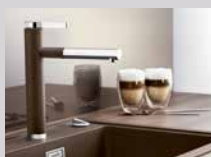
BLANCO LINEE-S im SILGRANIT®-Look.