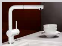
BLANCO LINUS-S im Keramik-Look.